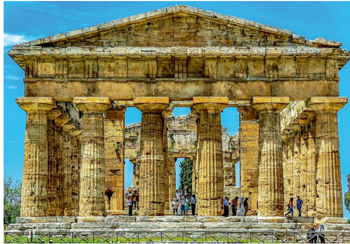
Der Poseidontempel in Paestum