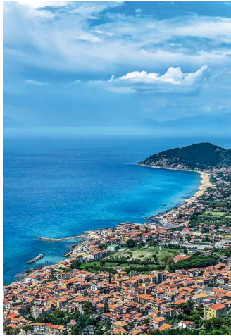
Die Küste bei San Marco