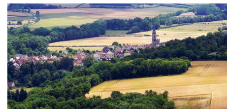
Aussicht von Vézelay