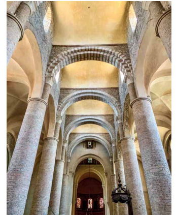
Abteikirche St. Philibert, Tournus