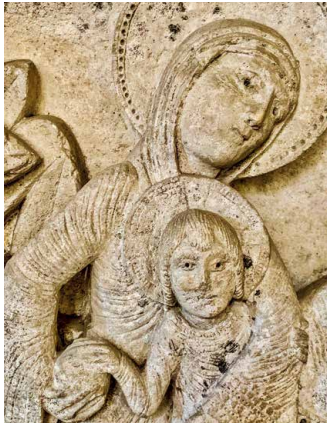
Einfühlsamkeit: Gislebertus von Autun