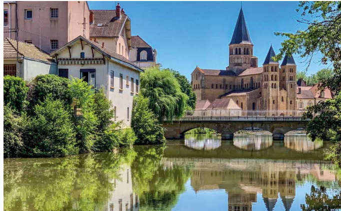
Paray le Monial